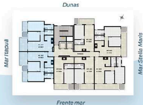
Planta Tipo 1