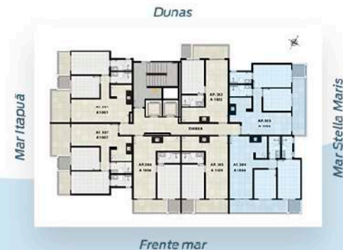
Planta Tipo 2