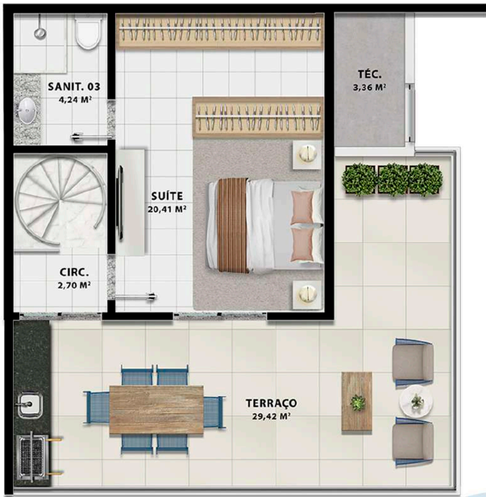
Planta Tipo 2