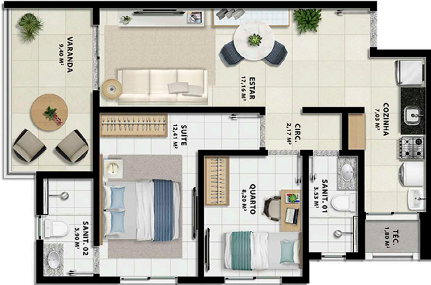
Planta Tipo 2