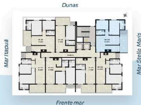
Planta Tipo 3