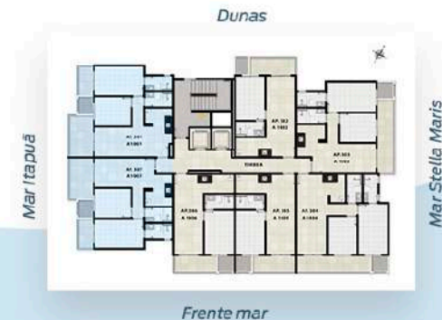
Planta Tipo 1